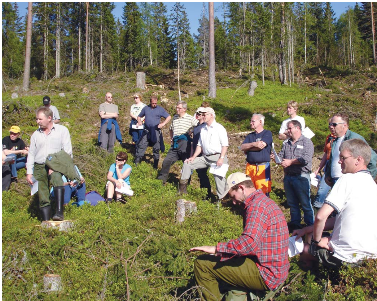
Interesserte skogeiere på intensivkurs i Levende Skog standard i Kongsberg.