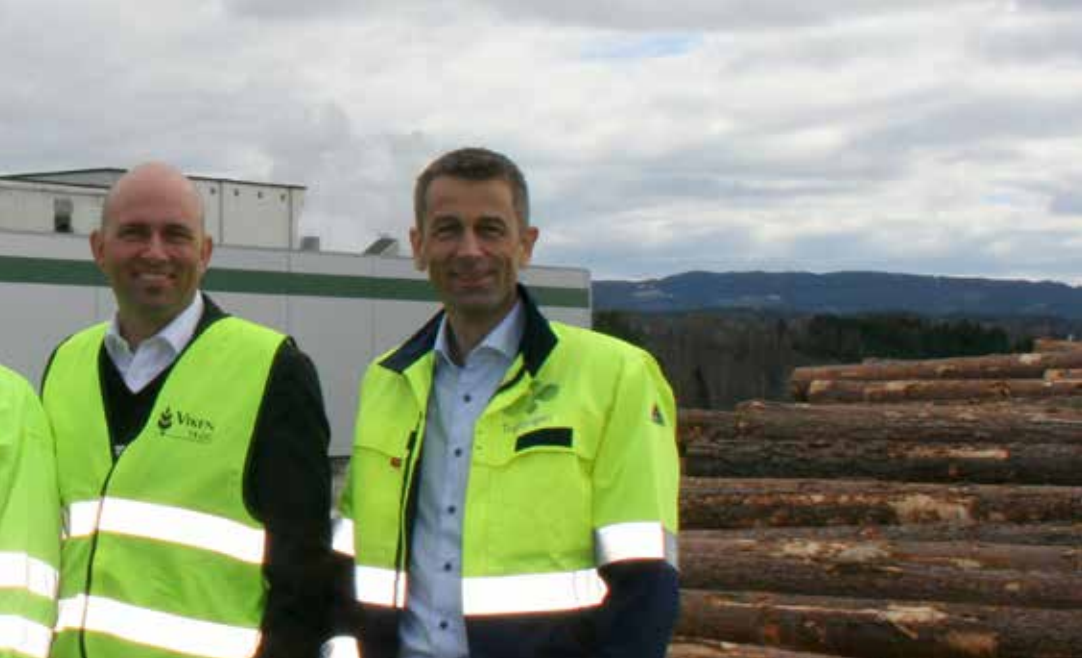
Samarbeidsavtale med St1 om biodrivstoff på Follum