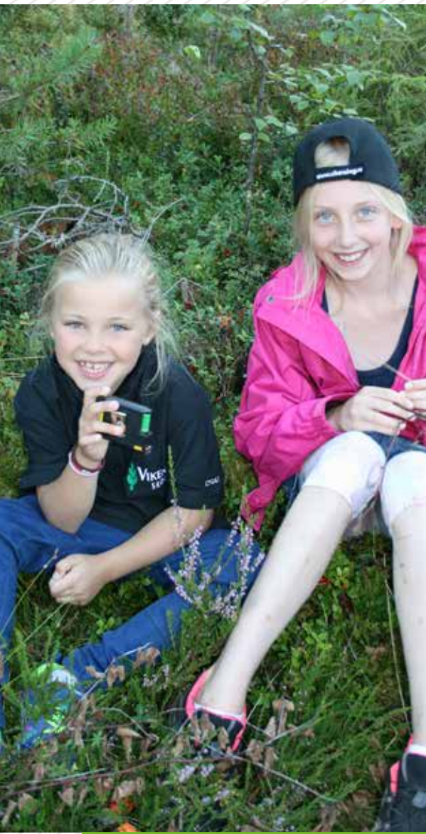
«Robuste skoger 2016» samlet både små og store skoginteresserte