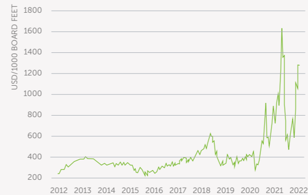
Grafen viser utviklingen av trelastprisene i USA fra 2012 til nå. 1 000 board feet tilsvarer 2,36 kubikkmeter. Rekordene på 1 600 dollar (cirka 13 300 kroner) per 1 000 board feet ble satt på forsommeren i 2021.

Prisene på sagtømmer fortsatte å stige gjennom året på grunn av det gode markedet. Rekordhøye priser på trelast førte ikke til en like sterk utvikling i tømmerprisene, og gapet mellom tømmerpris og trelastpris har sjelden vært større. Dette medførte mange tøffe forhandlinger med sagbrukene for å få tømmerprisen opp. Fordi sagbrukene hadde god tilgang på tømmer gjennom store deler av året, var det vanskelig å øke tømmerprisene i tråd med de kraftige prisoppgangene på ferdigvarer. I tillegg begynte privatmarkedet å roe seg tidlig på høsten, noe som førte til