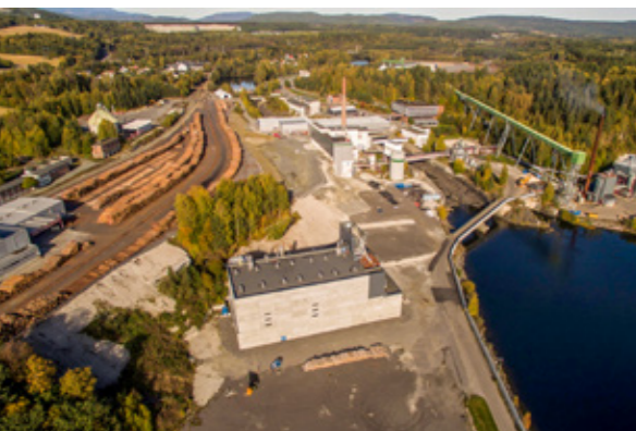
TREKLYNGEN INDUSTRIPARK I HØNEFOSS: Nærheten til skogrike områder og god kraftforsyning er faktorer som gjør industriparken attraktiv. I tillegg er det gode fraktmuligheter videre med tog.

Kontantstrømoppstillingen er utarbeidet etter den indirekte metode. Kontanter og kontantekvivalenter omfatter kontanter, bankinnskudd og andre kortsiktige, likvide plasseringer.