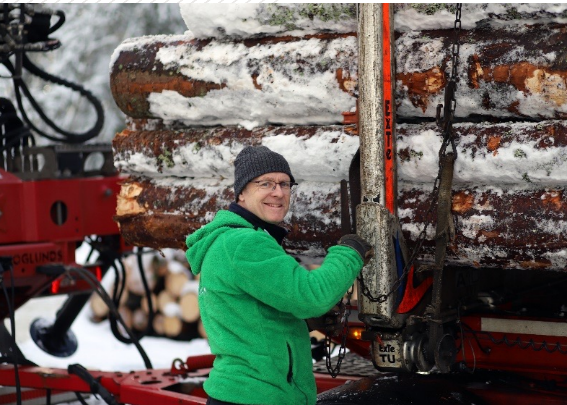
FRA VELTE TIL INDUSTRI: Transportørene sørger for effektivitet, presisjon og sikkerhet på veien.