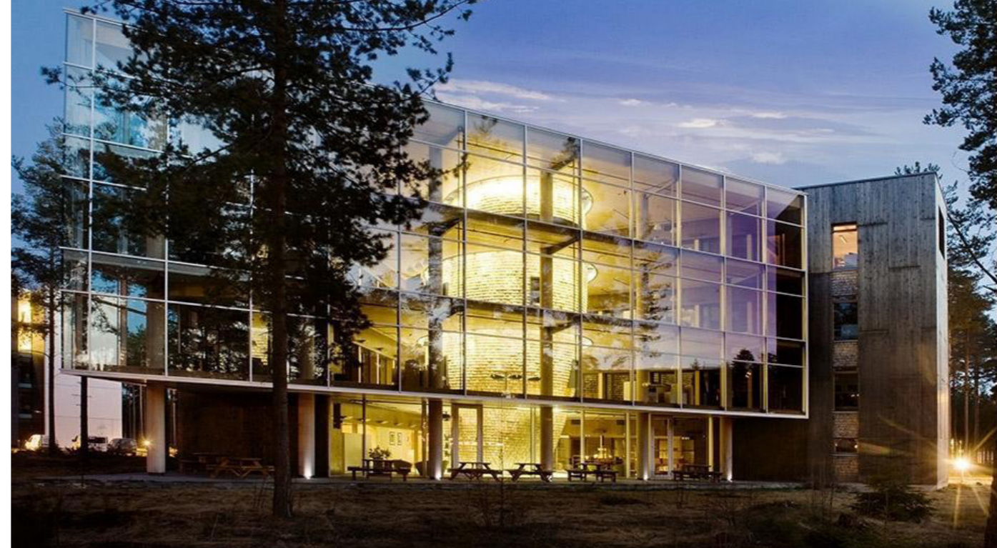
HOVEDKONTOR VIKEN SKOG: Bygget består av 8 forskjellige trematerialer; gran, furu, eik, malm, bjørk, kebonøy lønn og hassel. Kongla strekker seg gjennom byggets fire etasjer.

Viken Skog har de siste årene engasjert seg mer for å sikre og forbedre infrastrukturen for skogbruket i vår region. Lierstranda er landets største og viktigste tømmerhavn, men må etter all sannsynlighet relokaliseres innen 2029 i henhold til vedtatte kommunale planer i Lier. Vi har arbeidet aktivt med alliansebygging og deltakelse i regionale og lokale planprosesser.