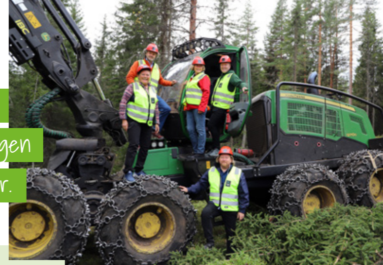
VALGKAMP: Politikere med ut i felt ved Sokna i august.

” Klima, bærekraft og miljø er en global megatrend der skogen vil være en viktig bidragsyter.