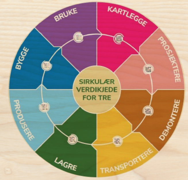
GRØNN STORSATSNING: Samarbeid om ombruk av returtre. Viken Skog er partner i prosjektet SirkTre.

Samfunnstrender som urbanisering, globalisering og miljø- og klimaspørsmål øker, og det samme gjelder oppslutningen om miljøorganisasjonene og miljøpartiene. Samtidig viser holdningsundersøkelser utført av Norges Skogeierforbund et svært lavt kunnskapsnivå om skogbruk i befolkningen. Dette er bakgrunnen for at hele den norske skog- og trenæringen i 2018 samlet seg om kommunikasjonsprosjektet Tenk Tre.