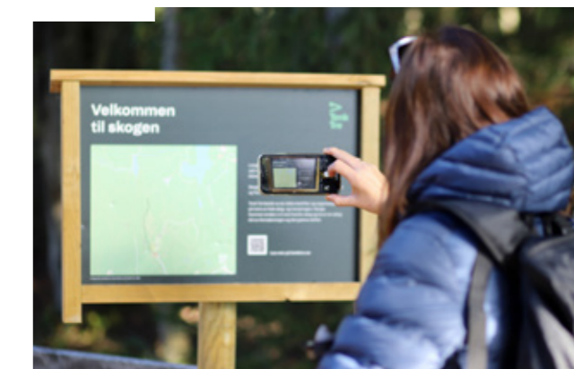
SKILT LANGS TURVEIEN: Skilte med informasjon om skogbruk og skognæringen er et av initiativene Tenk Tre har jobbet med gjennom året. Dette er fra Asker. Se tenktre.no

Det overordnede målet var å mobilisere skog- og trenæringen ved å skape stolthet rundt bidraget til samfunnet, vise folk flest at norsk skog- og trebasert næring er fremtidsrettet og gir klimavennlig verdiskaping, samt å overbevise politikere og myndigheter om at skog- og trenæringen er en viktig del av svaret på hva Norge skal leve av etter oljen. Viken Skog har vært en aktiv deltaker både finansielt og i gjennomføringen av prosjektet. Fra 2022 går Tenk Tre over i en fase der vi skal trekke vekslar på det som allerede er produsert, men med færre ressurser siden oppslutningen fra industrien i stor grad opphører.